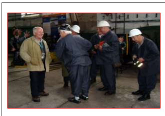
a kamarádi připraveni na sfárání do dolu